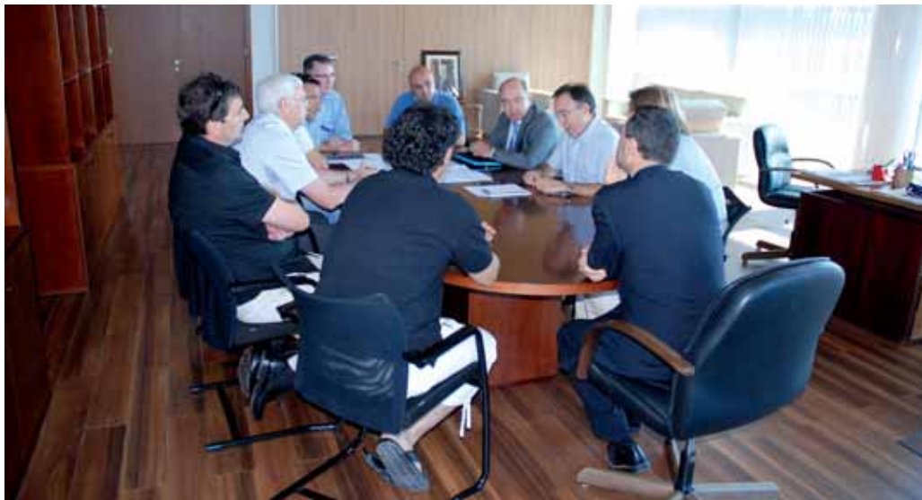
La comunidad portuaria de Tarragona mantuvo una reunión el martes en la sede de la APT para analizar este tema.

La comunidad portuaria de Tarragona recuerda que hace tiempo que mantiene relaciones con socios de Chery y espera en breve continuar estos contactos de manera directa