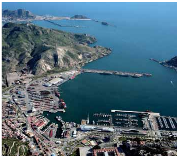
Puerto de Cartagena.

El Puerto de Cartagena comienza a recuperar el tráfico perdido y en el mes de julio las estadísticas se cerraron en positivo. El tráfico de mercancías por el enclave se incrementó un 8,26%, respecto al tráfico contabilizado en el mismo mes del ejercicio de 2009, durante el mes de julio.