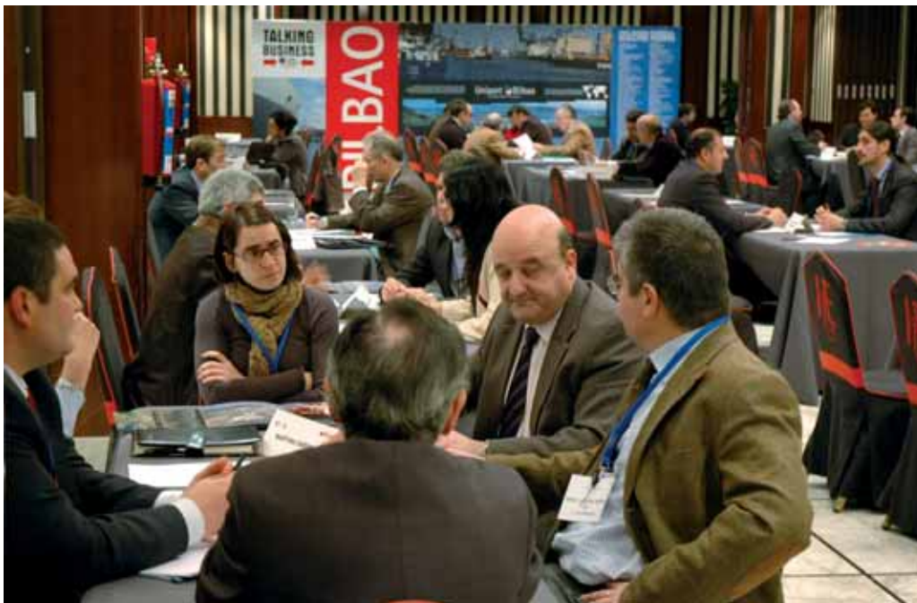
Las jornadas empresariales "Talking Business" organizadas por Uniport se iniciaron a Bilbao el pasado año.