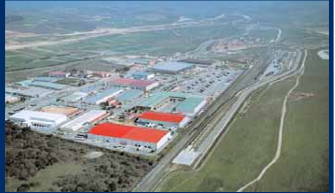
El Puerto Seco de Villafría se encuentra junto al Centro de Transportes de Burgos.

En este sentido, las conexiones ferroviarias han sido un requisito sine qua non a la hora de buscar emplazamientos estratégicos, como es el caso de la opción de Pancorbo, barajada por la propia APB hace unos meses, aunque la firme apuesta del Gobierno Vasco por la futura plataforma de Júndiz, en Vitoria, parece haber aparcado, al menos de momento, la opción de la denominada TELOF (Terminal Logística Ferroportuaria) de Pancorbo, para cuya financiación estaban previstos fondos a cargo del Plan Reindus del Ministerio de Industria. En cualquier caso, la APB continúa a la búsqueda de "espacios de oportunidad dotados de conexión ferroviaria", como en más de una ocasión