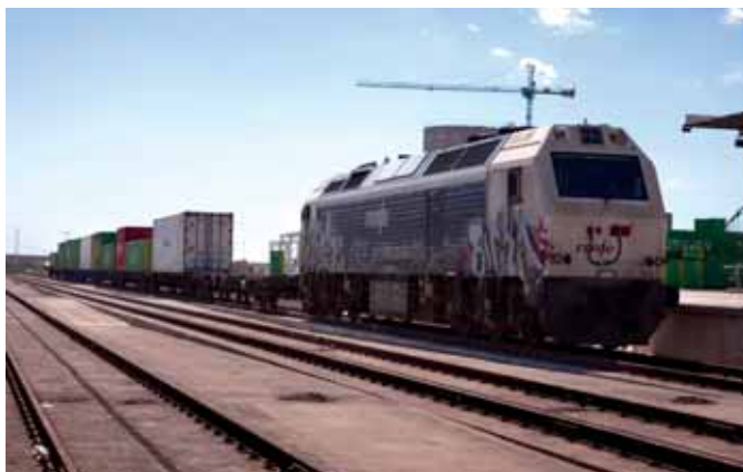
Llegó al enclave portuario a las 12.15 horas con un total de 20 TEUs.

El Puerto de Alicante recibió ayer el primer tren de contenedores de larga distancia en su historia. 20 TEUs con origen Madrid y con un punto de destino: la nueva terminal de mercancías del Puerto, ubicada en el muelle 21 de la zona de ampliación. Con ello, la Autoridad Portuaria ha dado un paso más en su camino hacia la intermodalidad.