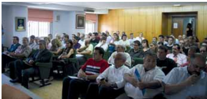
La jornada contó con número asistencia de la comunidad portuaria.

Aumentar la seguridad de las mercancías sin menoscabar la rapidez del comercio y del control fiscal es el objetivo de los nue-